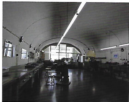
Obergeschoss, Kasematte rechte Face

Die Innenräume sind in gutem Zustand und werden gewerblich genutzt. Wesentliche Beeinträchtigungen des Baudenkmals durch die Nutzungen oder Gefährdungen der Substanz durch Bauschäden sind nicht vorhanden.