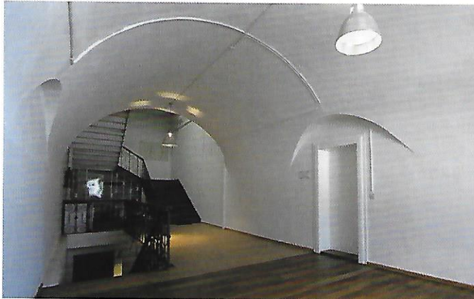
Obergeschoss, Treppenaufgang rechts

Erdgeschossgrundriss Kriegsspital, Originalplan Kriegsarchiv München.